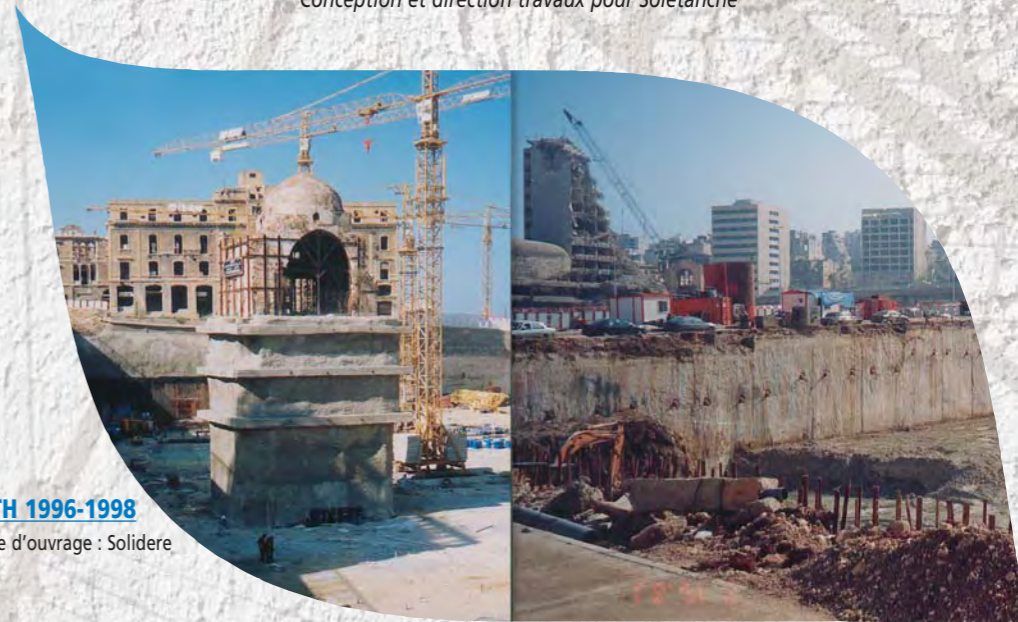
BEYROUTH 1996-1998 Maître d'ouvrage : Solidere