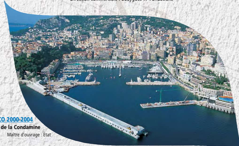
MONACO 2000-2004 Extension du Port de la Condamine Maître d'ouvrage : Etat